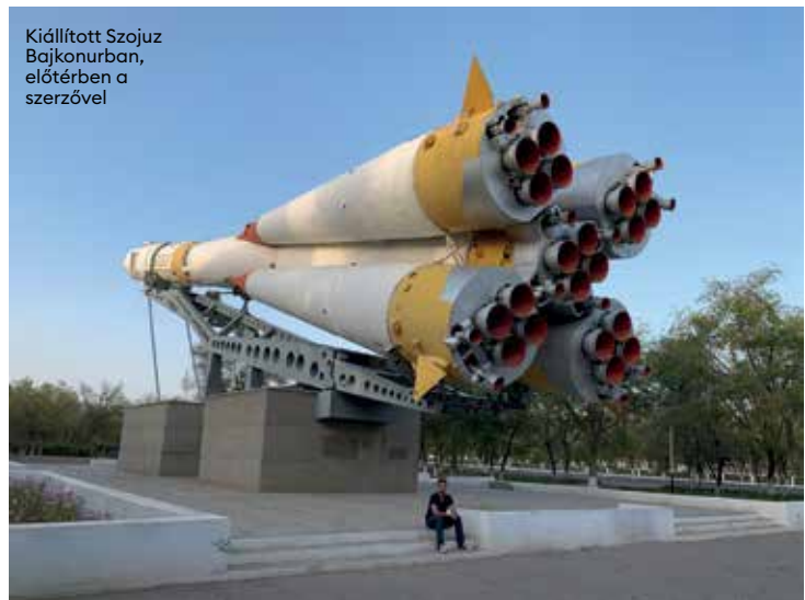
Kiállított Szojuz Bajkonurban, előtérben a szerzővel

SŐT ITT JÖN AZ A PONT, AMIKOR ÉRDEMES MEGCSILLOGTATNUNK A TÖBBI TÜRK NYELVŰ ORSZÁGBAN IS BEVETHETŐ KAZAHTUDÁSUNKAT. SZÓVAL: HOGY IS VAN KAZAHUL AZ, HOGY ALMA? ÉS A BALTA? PONT ÍGY.