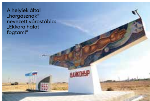
A helyiek által „horgásznak” nevezett várostábla: „Ekkora halat fogtam!”

előtti éjszakát, vagyis 1961. április 11-ét. A nem túl nagy szobában az egyik vaságyon aludt ő, a másikon German Tyitov, akinek be kellett volna ugrania – az űrkabinba és a világtörténelembe –, ha az első jelölttel